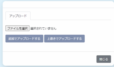
PAPERから書類をアップロードできる!

届いたFAXを紙で出力せずに、PDFで保存されるように複合機を設定すれば、送信されてきたケアプランなどもそのまま PAPERへ保存! 事務処理の時間が短縮されて残業が減った!